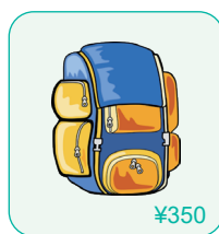
more expensive 更贵的